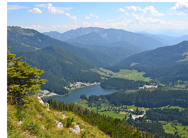
Blick von der Brecherspitze

Anreise Donnerstag ab 12 Uhr – Begrüßungsrunde um 15 Uhr, danach Qigong am Josefsthaler Wasserfall